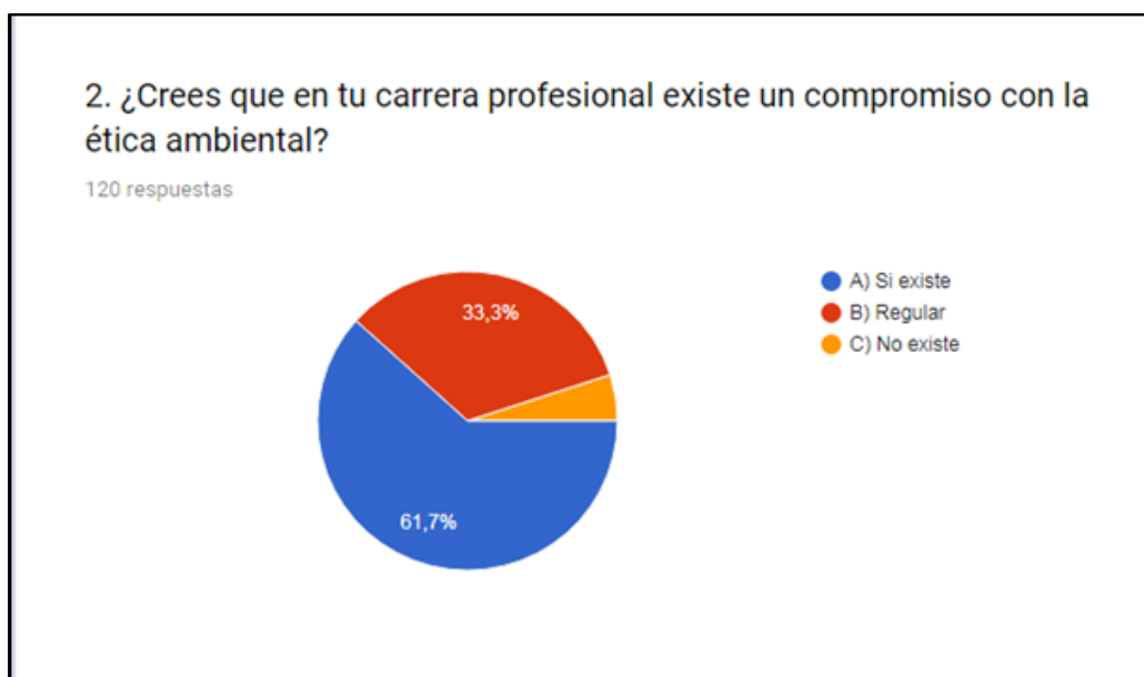
Gráfico No.2 Porcentaje de percepción del compromiso con la ética ambiental de acuerdo al semestre

El 61% de los estudiantes reconoce que existe un compromiso en este tema, sin embargo, el 33% asume que el compromiso no es tan evidente, finalmente apenas el 5% declaró que no existe un compromiso ético ambiental en la carrera de Biología.